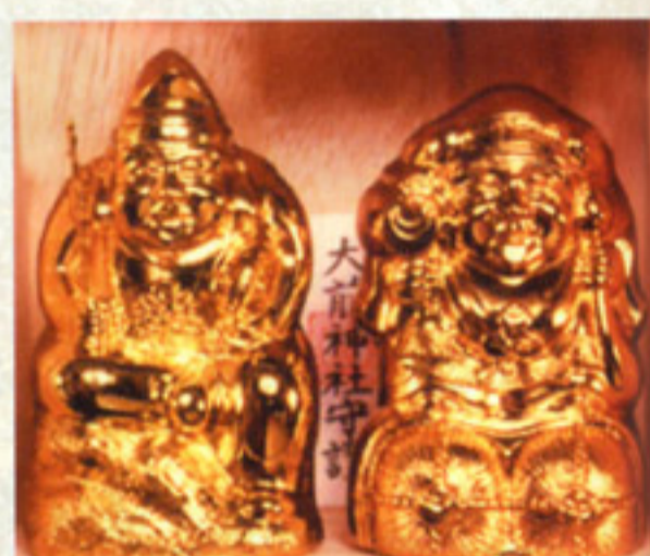
大前神社のご祭神、恵比寿様と大国様の黄金の縁起物。一家にひとつは欲しい！(5000円〜)

全国から「宝くじが当たりました！」のお礼が続々寄せられているが、高額当せんのお礼もけっこうあるらしい！